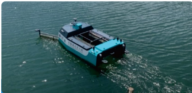
新加坡西海岸港口